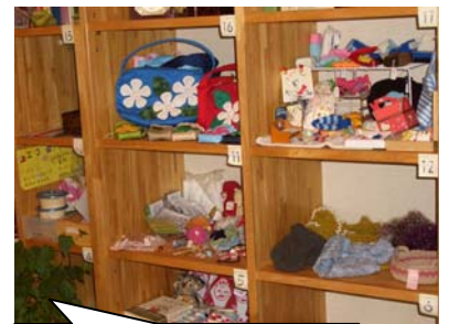
レンタル box の様子

なじみ庵のレンタルBOXはかわいい手作り小物、パッチワークやハワイアンキルト、ビーズの可愛い動物たちなど、素敵な手づくり作品に出会えます。贈り物に、喜んでもらえること、間違いなしです。一度ご覧になってみてください。手づくり作品を販売してみたい方もお待ちしております。