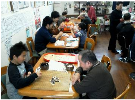
↑五目ならべ、トランプ、おはじき

当日は、3歳から、92歳まで、老若男女、いろいろな人がごちゃまぜになって、教えたり教えられたり、昔の遊びを楽しみました。あやとり、独楽づくり、お手玉、こま回し、おはじき、コリントゲーム、缶ぽっくり、シャボン玉、ビー玉、ぶんぶんゴマ、けん玉、五目ならべ、なわとび、将棋、メンコ、トランプ、カンけり、・・・子供も大人も遊びに夢中！ なかなか昔の遊びは終わりません。