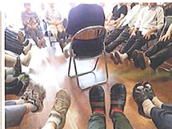
教室参加者平均年齢86歳 視察のゲストも一緒に

【オレンジカフェ】8/13、9/10(木) 13:30~15:30 オレンジカフェは、認知症の人や家族、地域の人、専門職、誰もが気軽に参加できるつどい場です。 お盆の13日、なじみ庵はお休みですが、「オレンジ・カフェ」この機会にいかがですか。 [上記の申込み問合せ39-6515なじみ庵]